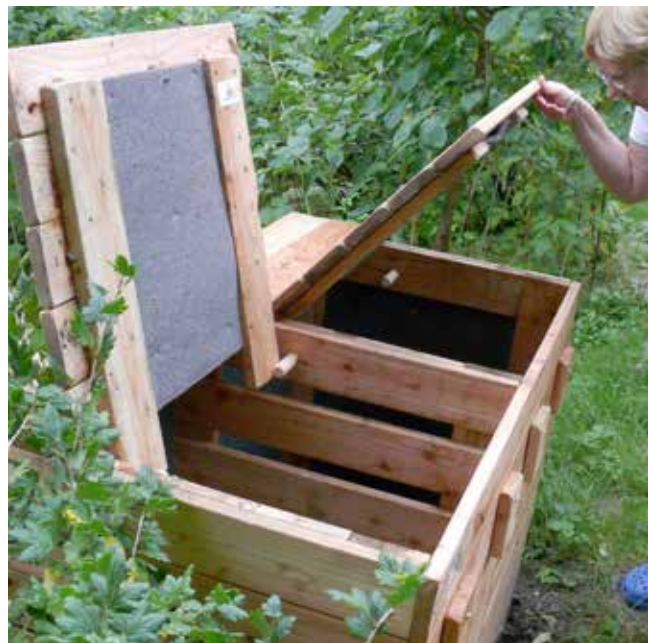
Kompostbehållare med två bingar.

Det får inte vara så blött att det blir syrebrist, innehåller den dessutom mycket kväverikt material från matrester