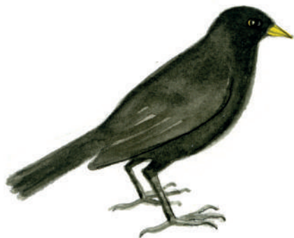
Koltrast, mus, padda och groda är djur som också äter snäckor, sniglar och deras ägg.