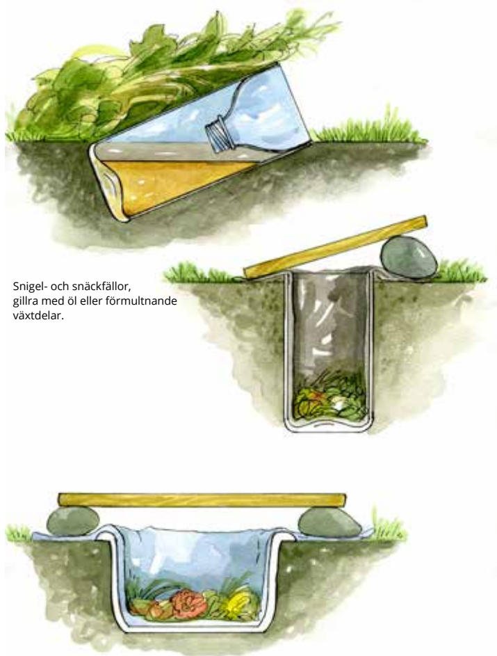
Snigel- och snäckfällor, gillra med öl eller förmultnande växtdelar.

Av gamla sirapsflaskor kan man göra en enkel fälla. Skär av flaskan en bit nedanför mynningen, stick öppningen inåt i flaskan och tejpa fast. Häll i lite öl och placera flaskan bland växterna, lite snett nedgrävd i jorden. Vittja flaskan genom att lossa lätt på tejp.