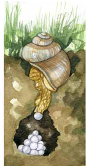
Till höger: vinbergssnäckan.

är mörkt. De gömmer sig i jorden, under blad eller liknande när det blir för varmt och torrt. Fuktiga mullhaltiga lerjordar med ganska grov struktur är gynnsamt men de föredrar lite finare struktur för äggläggning. Torra sandjordar eller täta lerjordar gör det svårare för dem att gömma och föröka sig.