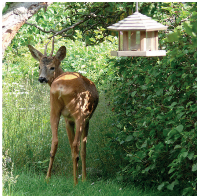
Fågelbord som är i äthöjd för rådjur eller där mycket fågelmat som säd och frön spiller över, lockar till sig rådjur under vintern. Rådjuren vänjer sig vid matplatsen och återkommer regelbundet även på sommaren men då blir det lökväxter, sommarblommor och grönsaker som står på menyn.