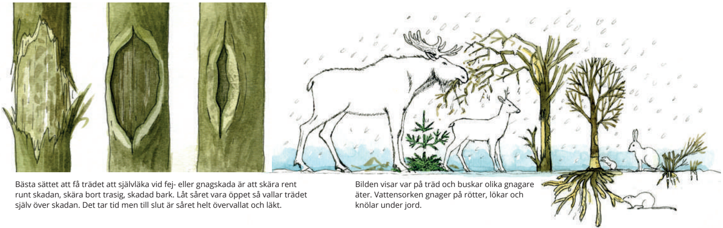
Bästa sättet att få trädet att självlåka vid fej- eller gnagskada är att skära rent runt skadan, skära bort trasig, skadad bark. Låt såret vara öppet så vallar trädet själv över skadan. Det tar tid men till slut är såret helt övervallat och läkt.