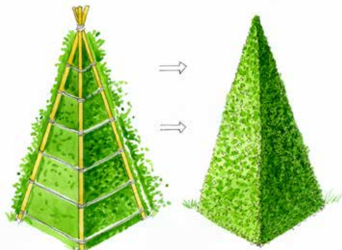
Formklippning buxbom, enkel pyramid

Buskar som måste klippas in varje år för att de egentligen inte får plats där de står, är bara till problem. Blomningen uteblir om man ansår i topparna varje år och buskarna är inte till den glädje de skulle kunna vara om de hade passat